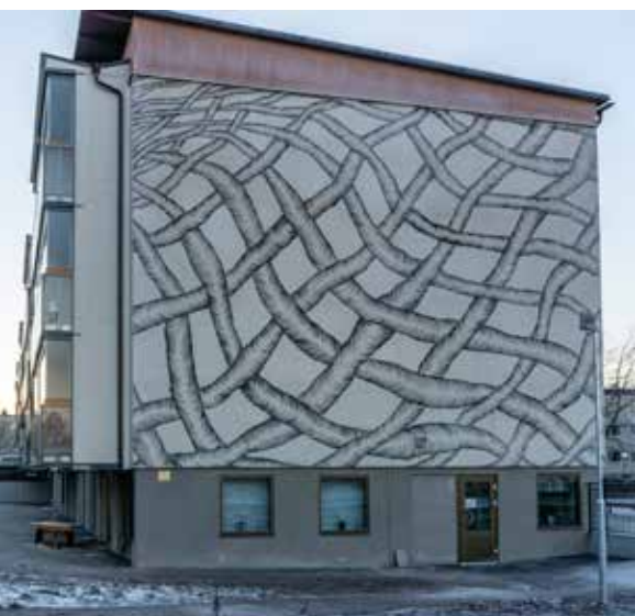
Skolvägen 2, Örbyhus