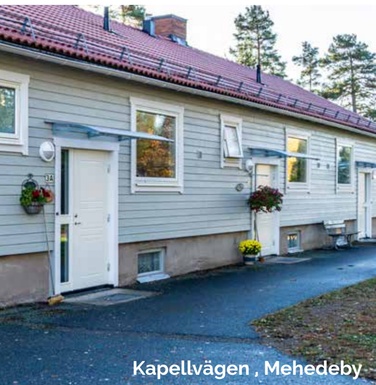
Kapellvägen , Mehedeby