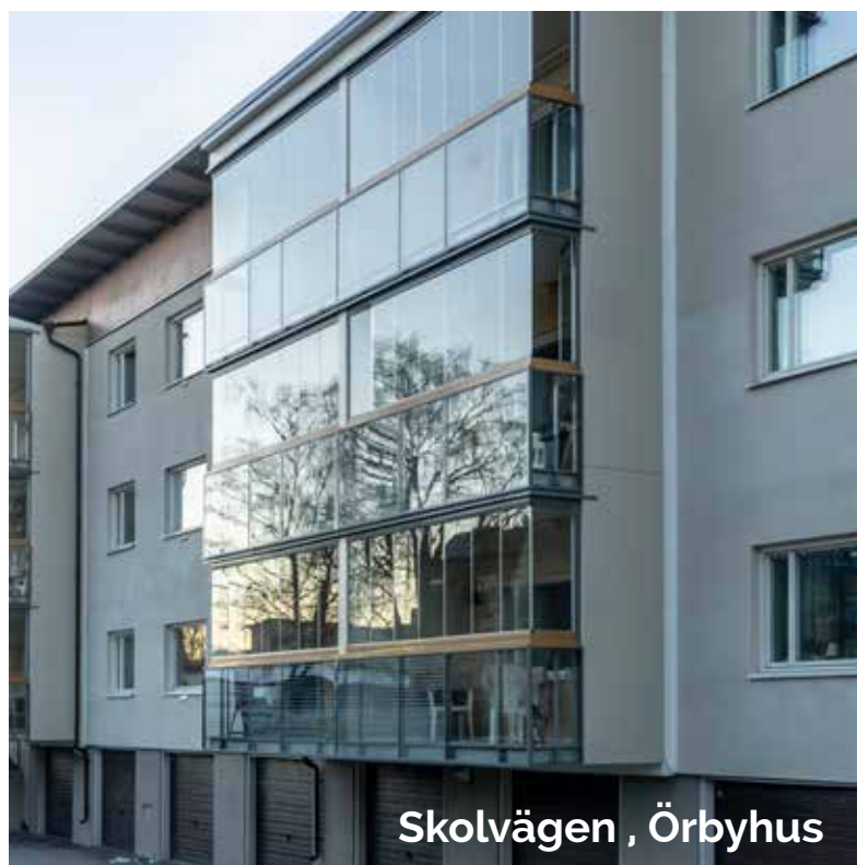
Skolvägen , Örbyhus