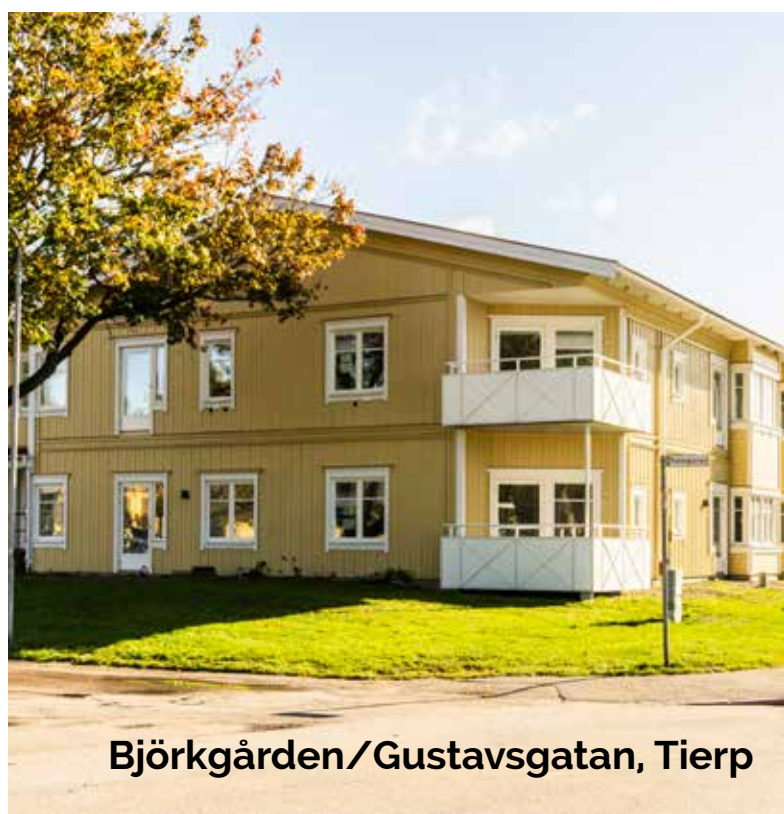
Björkgården / Gustavsgatan, Tierp